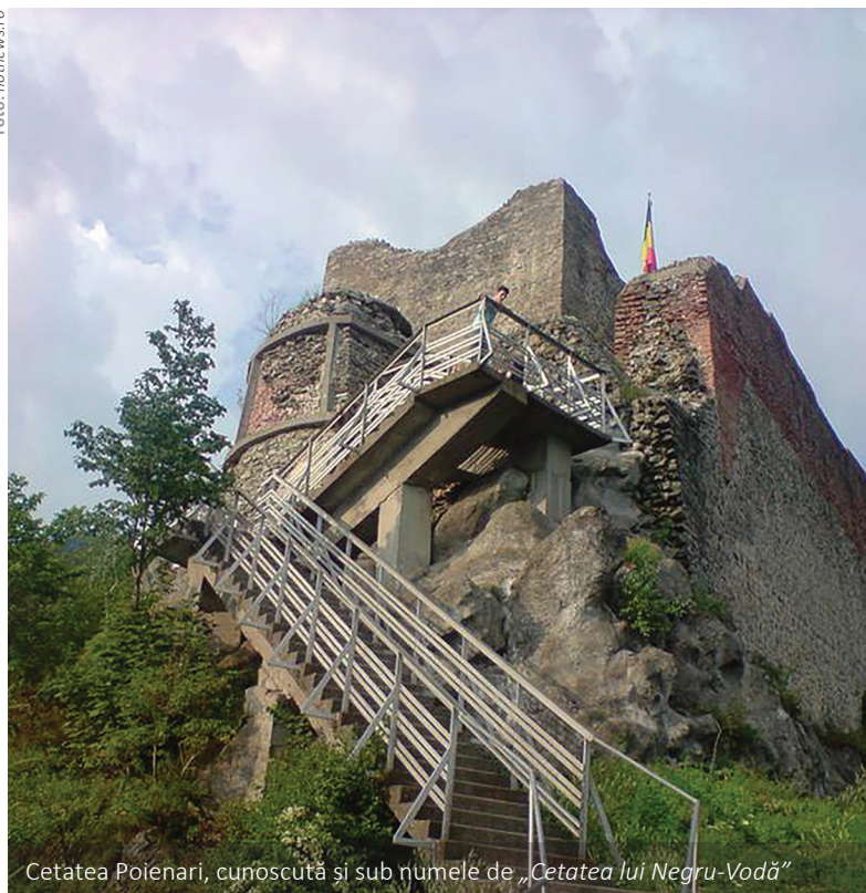
Cetatea Poienari, cunoscută și sub numele de „ Cetatea lui Negru-Vodă ”

„ Cetatea lui Negru-Vodă ” – cea mai veche fortificație cunoscută până în prezent la sud de Carpați – a reprezentat centrul unei puternice formațiuni statale geto-dacice distruse în cursul acțiunii de unificare și centralizare statală a populației dacice, întreprinse de regele Burebista.