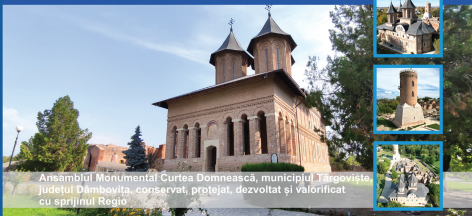
Ansamblul Monumental Curtea Domnească, municipiul Târgoviște, județul Dâmbovița, conservat, protejat, dezvoltat și valorificat cu sprijinul Regio